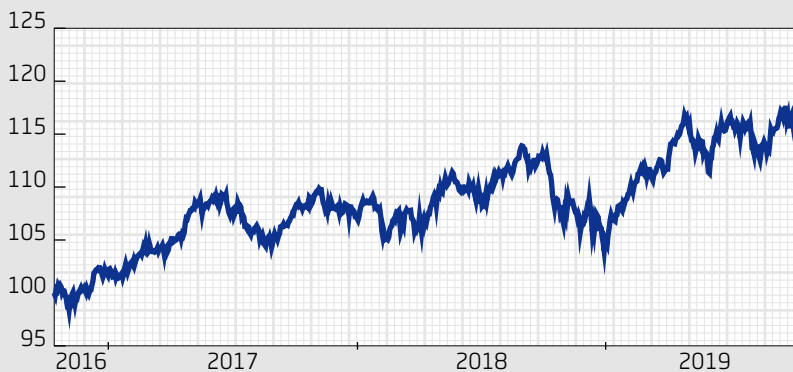
■ Fond: Swedbank Robur Access Mix