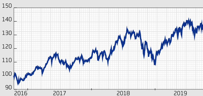
■ Fond: Swedbank Robur Småbolagsfond Sverige