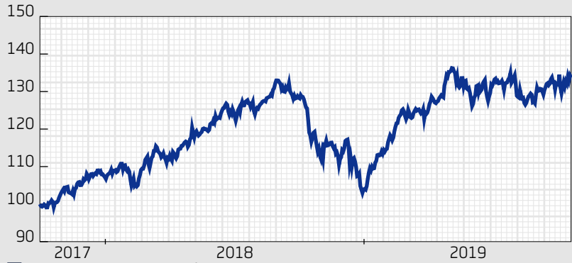
Fond: Swedbank Robur Småbolagsfond Glb A SEK