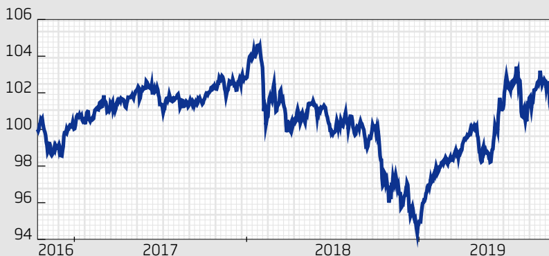
■ Fond: Schroder ISF Gbl MA Bal A Acc SEK H