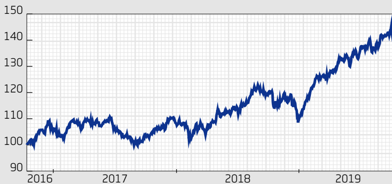
Fond: SPP Aktiefond Stabil A