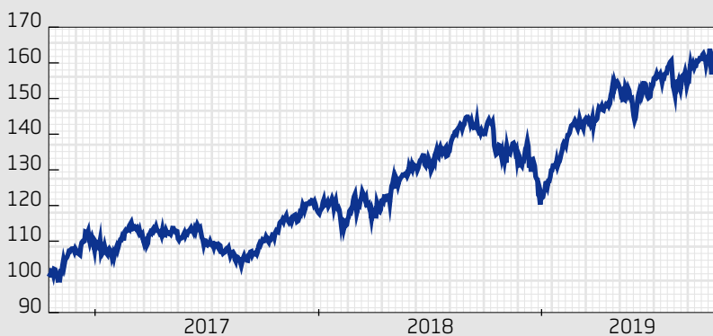
■ Fond: Swedbank Robur Access USA