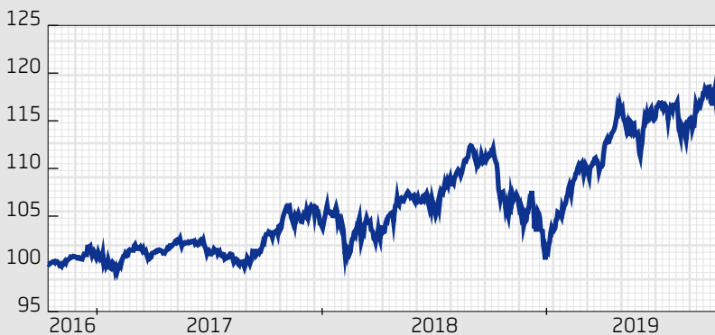
Fond: Swedbank Robur Stiftelsefond Utd