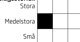
Värde MixTillväxt Aktievärdering