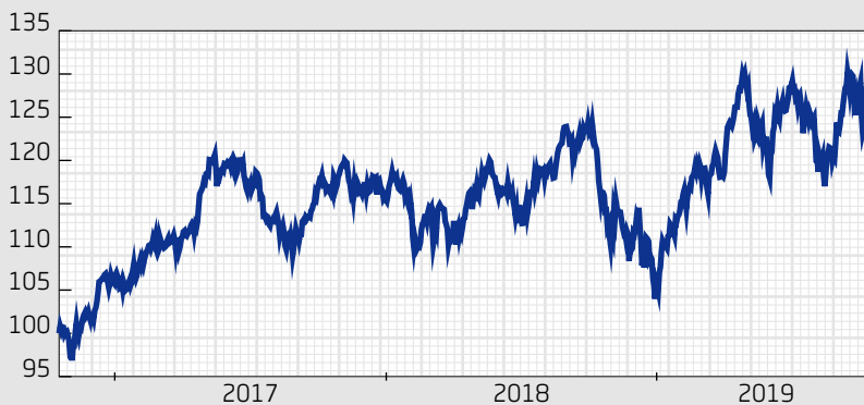
■ Fond: Swedbank Robur Transition Sweden MEGA