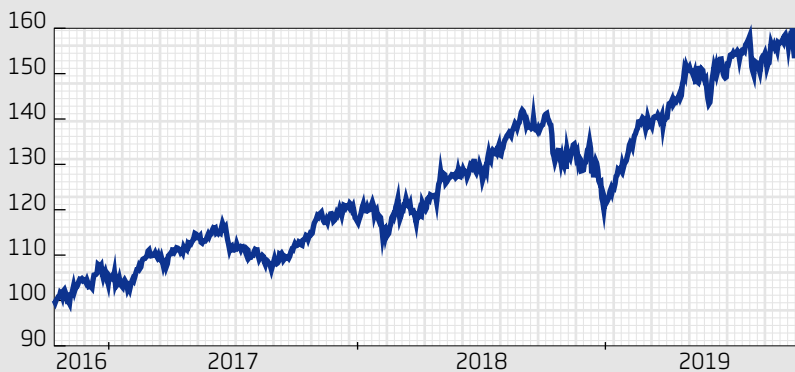
Fond: Swedbank Robur Transition Global MEGA